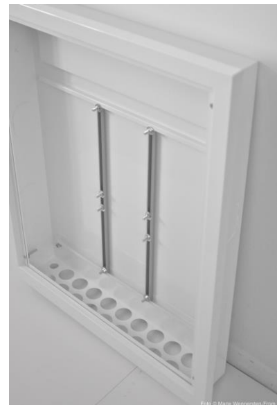
Tetragonia Fördelarskåp wtc

Tetragonia fördelarskåp wtc är anpassat för att kunna monteras i vägg med regeltjocklek av min. 95mm. I skåpets botten finns där hål som gummimuff ska monteras i samt uttag för dränagerör. På baksidan av skåpen finns 4 M8 muttrar som används för infästning av stativ då man vill montera skåp och fördelare innan gjutning. För vidare info se under rubrik 'Montage med hjälp av Tetragonia Skåpstativ'. Skåpet är tillverkat av 1 mm pulverlackerad stålplåt