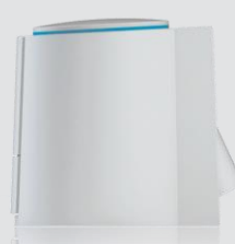
Standard m elkontakt